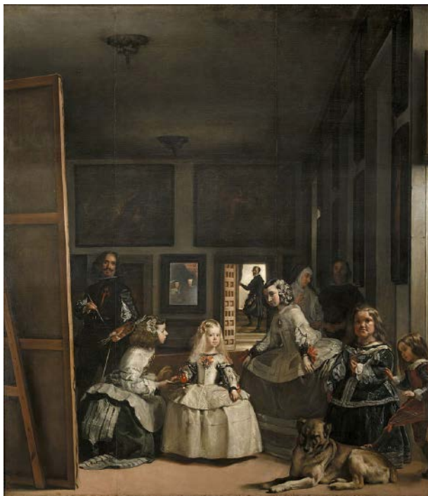
Las Meninas de Diego Velázquez (1656).