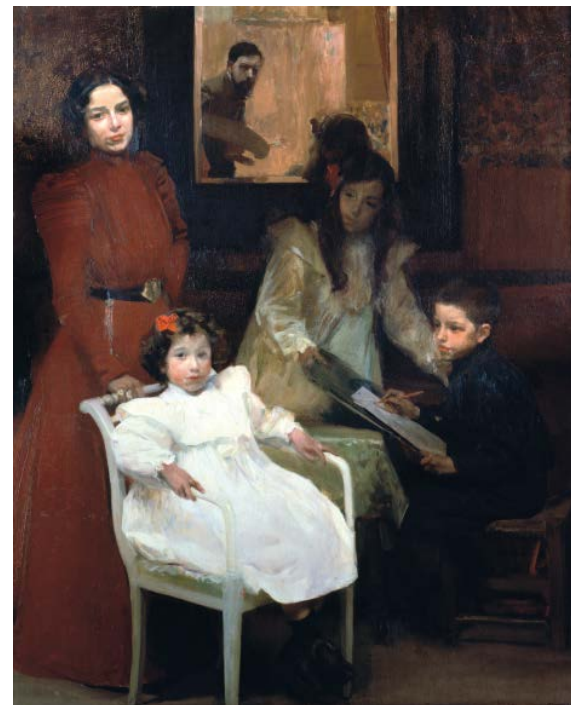
La familia del pintor de Joaquín Sorolla (1901).