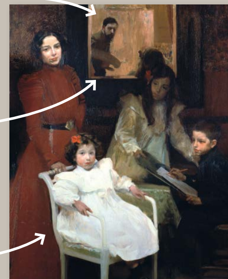
La familia del pintor de Joaquín Sorolla (1901).

Hay una niña en el centro del cuadro que mira al frente (al espectador).